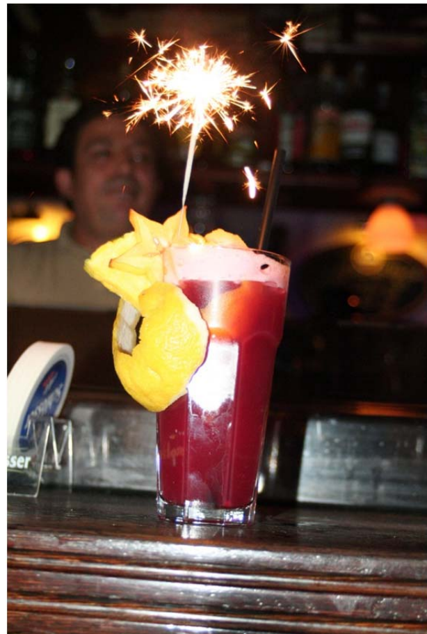
Numondu-Cocktail im „K5 – Stadtgeflüster“: Açaï-Beeren-Power sorgt für lange Nächte!

Die langen Party-Nächte im Haaner „K5 – Stadtgeflüster“ haben durch das exotische Getränk bereits gewonnen. Gastronom Brabender ist so begeistert von der Resonanz seiner Kundschaft, dass er bereits dabei ist, neue Numondu-Parties zu organisieren. Ganz nach dem Motto: The Party must go on! Wenn also auch „Kreuzberger Nächte“ lang sind – die Haaner Nachtstunden stehen ihnen nicht nach. Im Gegenteil! Das Haaner Partyvolk ist auch noch lange nach Mitternacht topfit im Rennen – dank NUMONDU, dem Powerdrink mit der Kraft der Açaï-Beere.